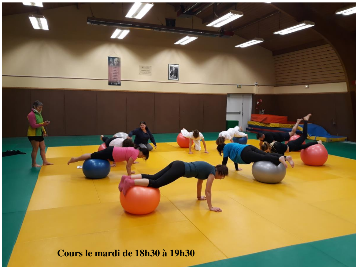
Cours le mardi de 18h30 à 19h30